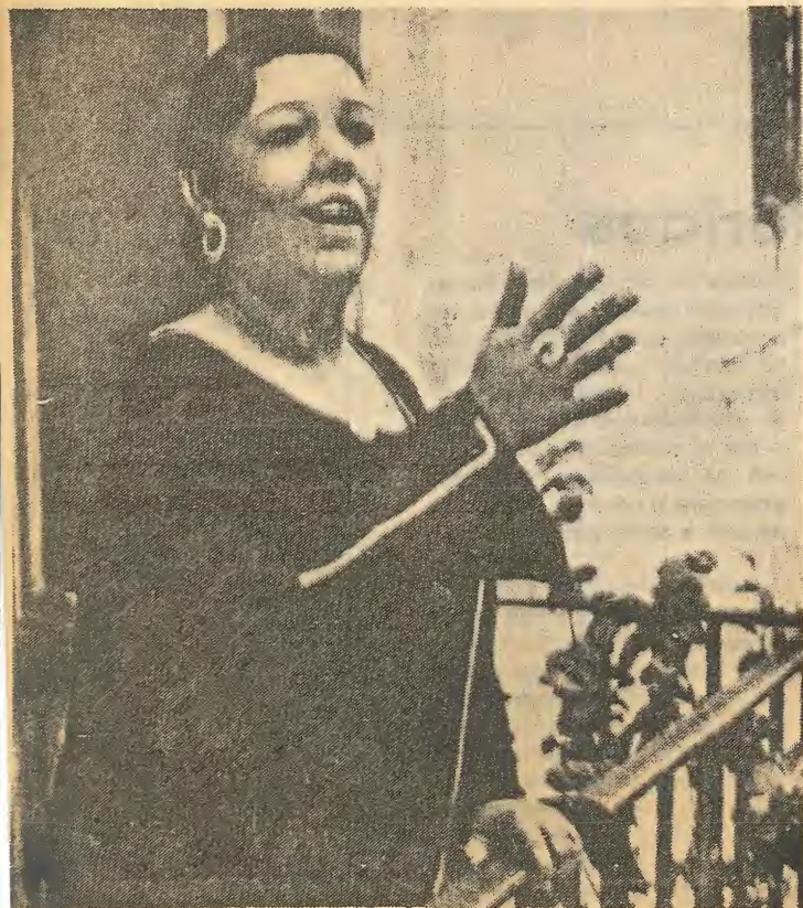
La Niña de los Peines cantando saetas desde el balcón de su casa sevillana.